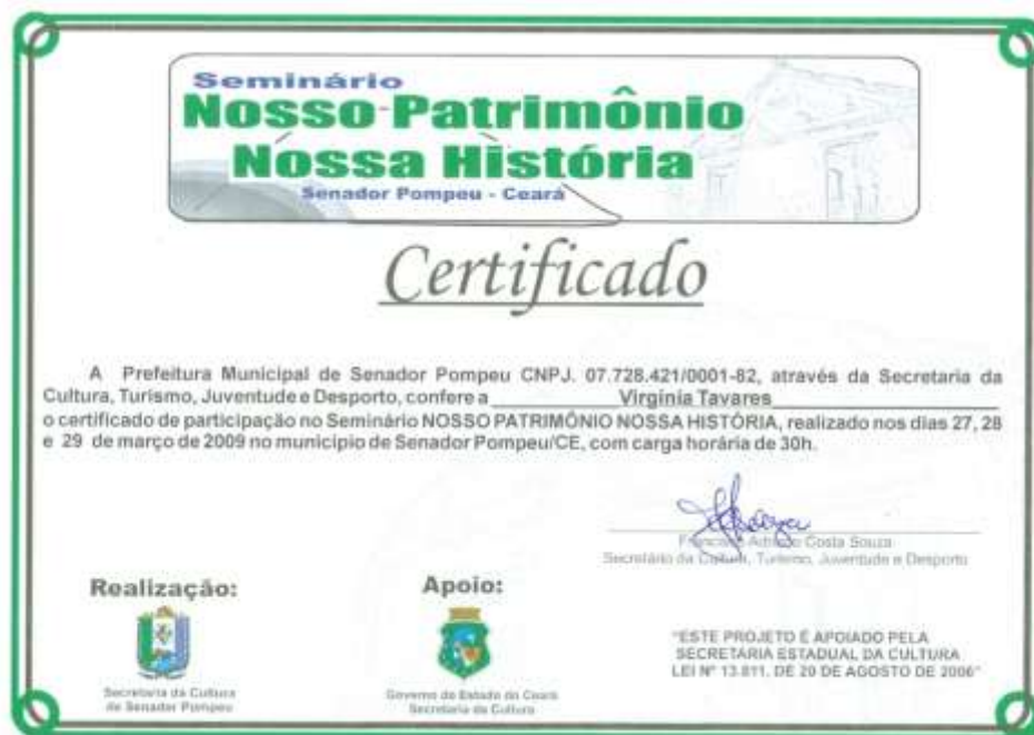
Fundação Santa Terezinha – Coordenadora de Artes - Senador Pompeu 2009