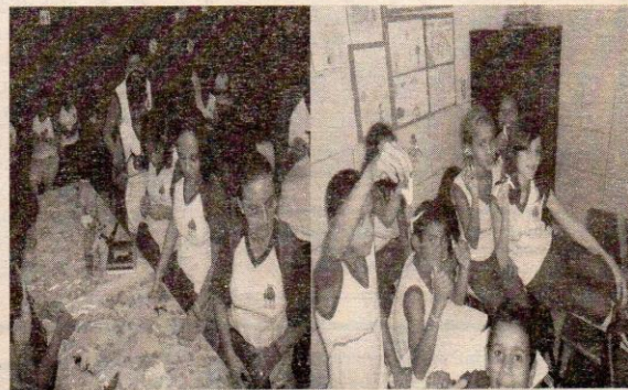
Oficina de Abayomi