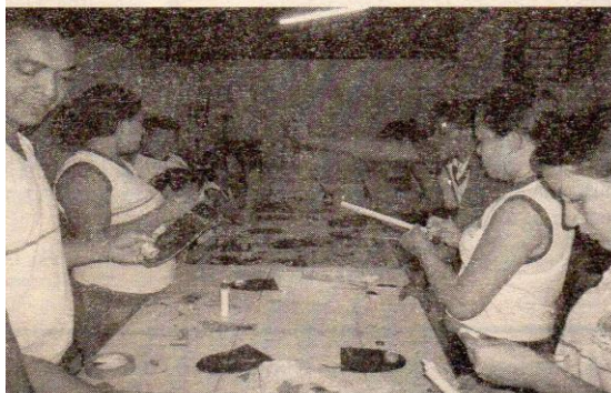
Oficina de máscaras

Contato: 8631 3064 - mail: museudabonecadepano@gmail.com