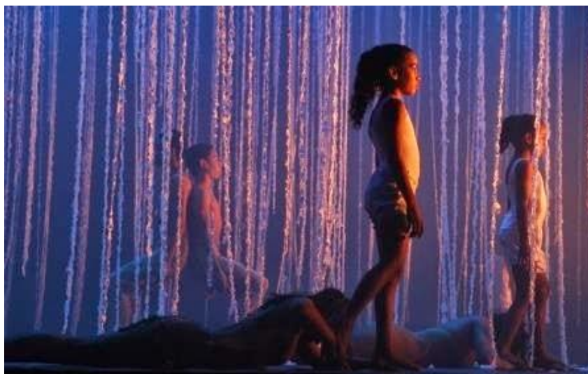
Histórias de Acordar o Amanhã.

A Vidança Cia de Dança do Ceará apresenta, na quarta edição da Bienal Internacional de Dança do Ceará/De Par em Par, os espetáculos Histórias de Acordar o Amanhã e No Jardim dos Girassóis durante o mês de novembro. No dia 09, a Vidança chega ao Crato, no auditório da Rádio Educadora, e no dia 15 em Pacajus, no antigo Campo do Guarany, sempre a partir das 21h. No último dia 02, a apresentação aconteceu na Praça Principal em Paracuru. A entrada é gratuita.