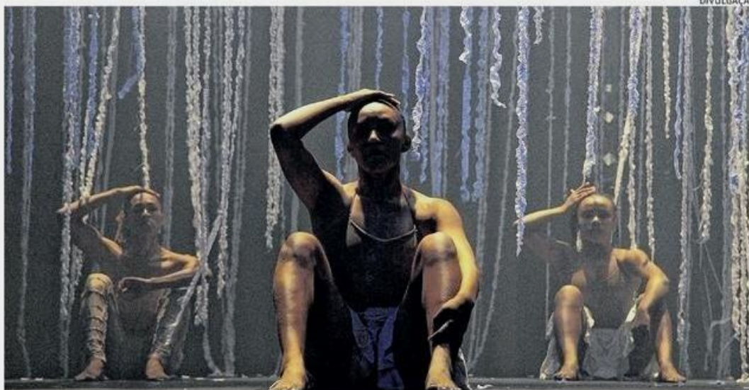
Espectáculo de dança Histórias de Acordar o Amanhã : processo coletivo que traz elementos cotidianos do bairro Velha Velha