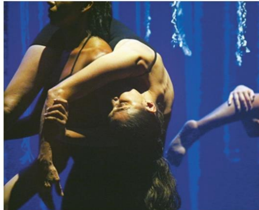
Balé clássico e cultura popular orientam o repertório da companhia, que já contabiliza três décadas de atuação. Apresentação de espetáculo, exposição fotográfica e lançamento de livro marcam o aniversário do grupo.

Acompanhando "Histórias de Acordar o Amanhã", a mos-