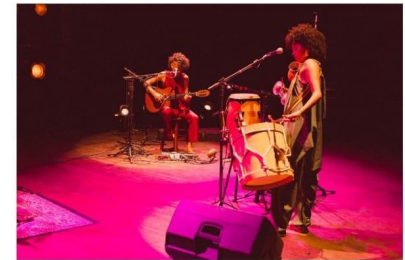
Neste domingo (6), banda Viramundo estreia na MOPI8 com show virtual do EP “Fortalezas”

4 DE JUNHO DE 2021 - 15:20 | #Banda Viramundo #Cultura #Evento Virtual #MOPI8 #Secult #Show Musical Raphaelle Batista - Ascom Porto Iracema das Artes - Texto Alan Sousa - Foto