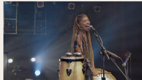
A BANDA CEARENSE VIRAMUNDO

Força, grandeza e beleza. Do tronco largo, das folhas que alcançam o infinito. E além. Tenham o prazer na vida de reconhecer e se abraçar, pelo menos uma vez, com um baobá. Há um mistério em Fortaleza: são poucos os exemplares dessa árvore por aqui. Se você se encontrar com uma, celebre e faça seu rezo. O seu caminho será de bênção.