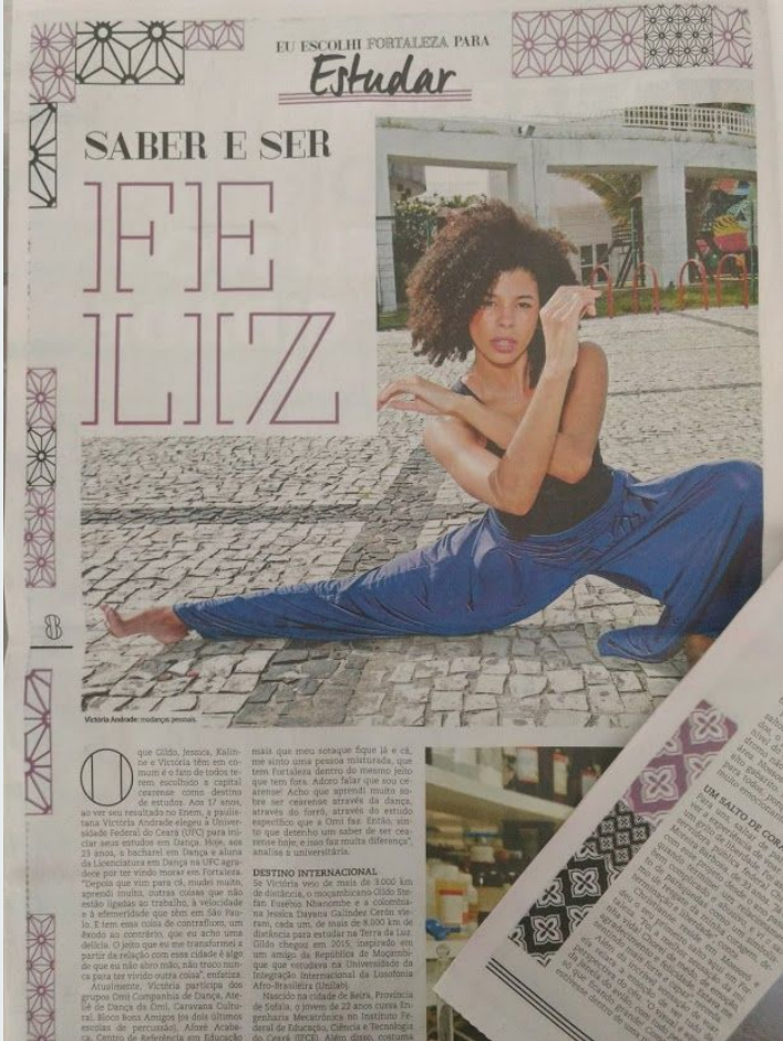
Entrevista para o diário do Nordeste (2018)