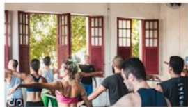
Daphnis e os bailarinos: ensaios para a performance começaram no mês passado

O bailarino grego Daphnis Γαβριήλ Κόκκινος e a coreógrafa alemã Pina Bausch