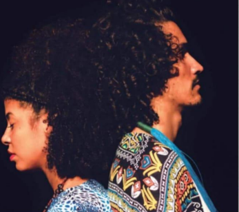
Siga a novidade em @viramundo.

Viramundo e Berg Forteza lançam trabalhos autorais nesta sexta-feira (13) | 303