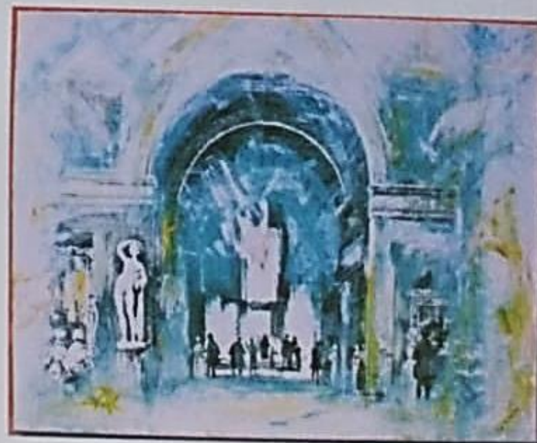
O Arco do Triunfo Serigrafia e acrílica sobre tela 110 x 130cm 2004