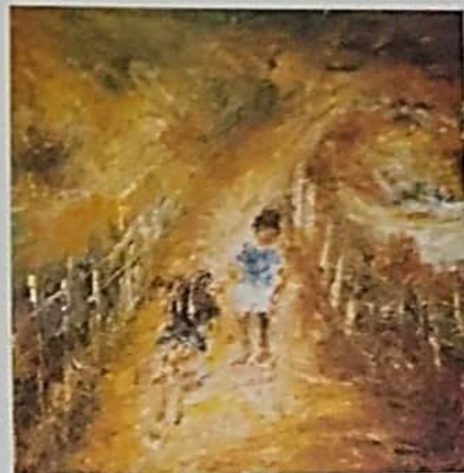
"Encontro na Estrada do Fio" - 2001 - acrílica sobre tela - tam.: 100cm x 100cm