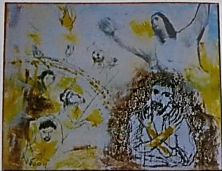
Misericórdia Serigrafia e acrílica sobre tela 110 x 130cm 2004