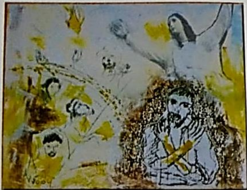
Misericórdia Serigrafia e acrílica sobre tela 110 x 130cm 2004