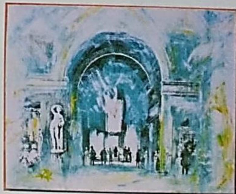
O Arco do Triunfo Serigrafia e acrílica sobre tela 110 x 130cm 2004