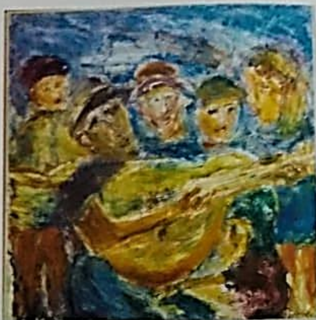
"O Violino e os Ovos" - 2001 - acrílica sobre tela - tam.: 100cm x 100cm

Ao olhar para esta tela do A. Rocha, vejo que está cheio de intenções pessoais. Intenções essas, que perpassam desde a paleta de cores vibrantes, até as reais intenções que movem o seu autor - o A. Rocha em direção à construção de suas verdades pessoais. Afinal de contas, como diz Mário Pedrosa: "A arte é um exercício experimental da liberdade". E eu creio que seja assim que o amigo A. Rocha de sinta; livre para experimentar e ir à busca de um caminho que o possibilite revelar suas verdades pessoais.