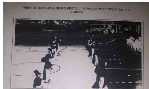
ABERTURA DA 4ª FASE DO FESTAL – GINÁSIO POLIESPORTIVO DE SOBRAL