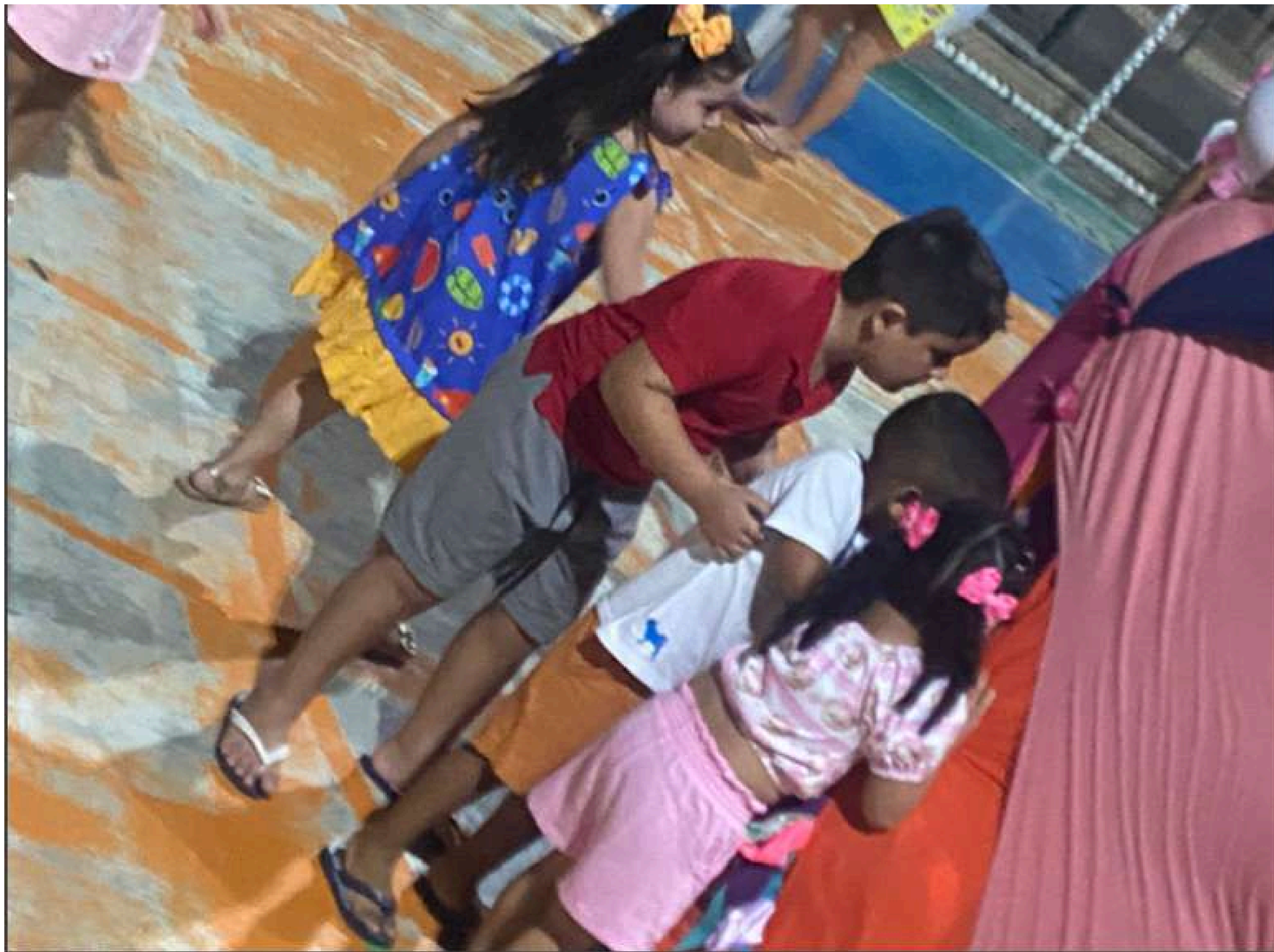
3º Bienal Intenacional de Dança Criança-2024 - - Espetáculo Pien - Praça mais Infância - Pacatuba