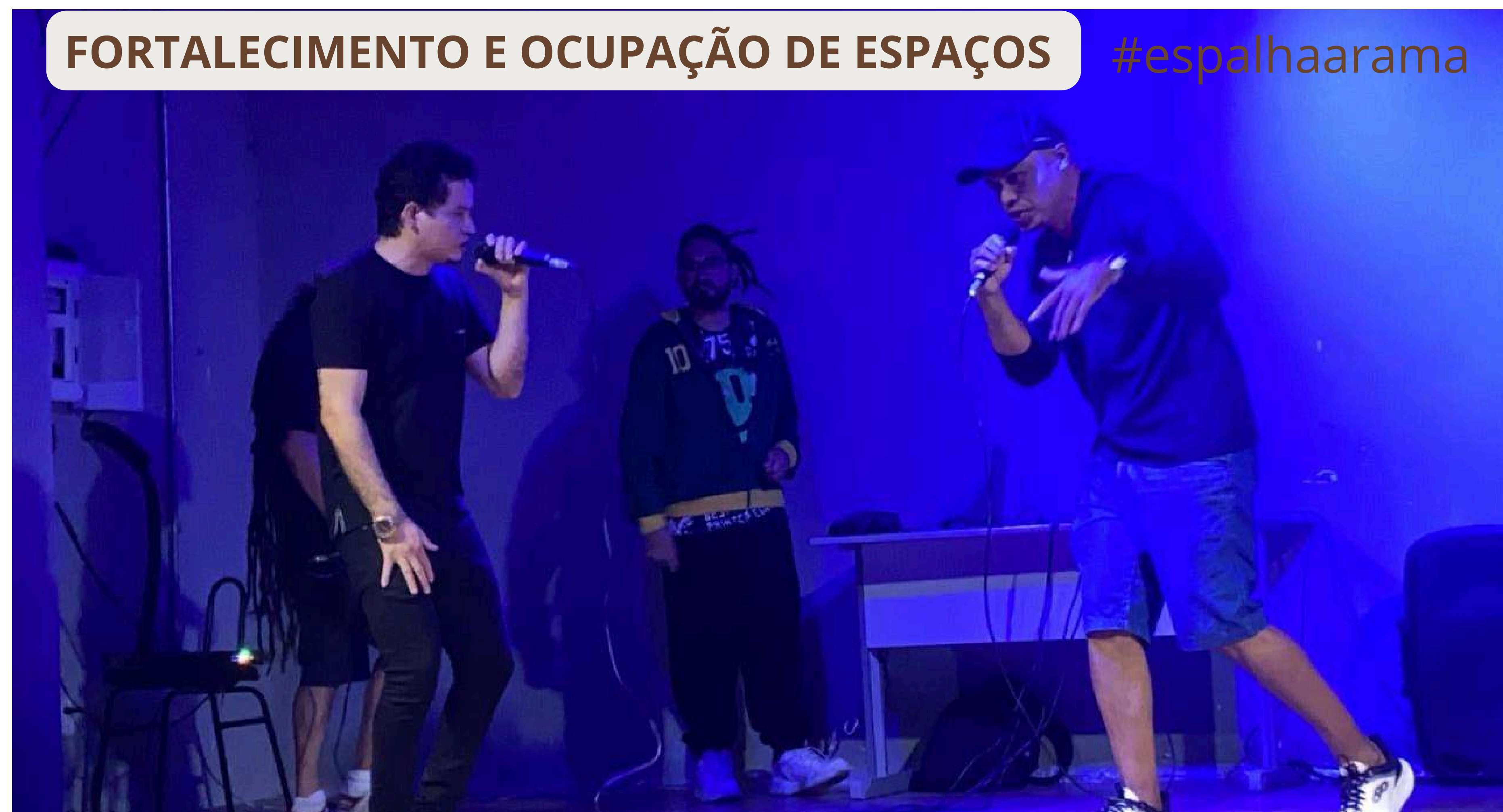
Grupo Hip Hop Cassino 12 CEU - Jereissati - Pacatuba