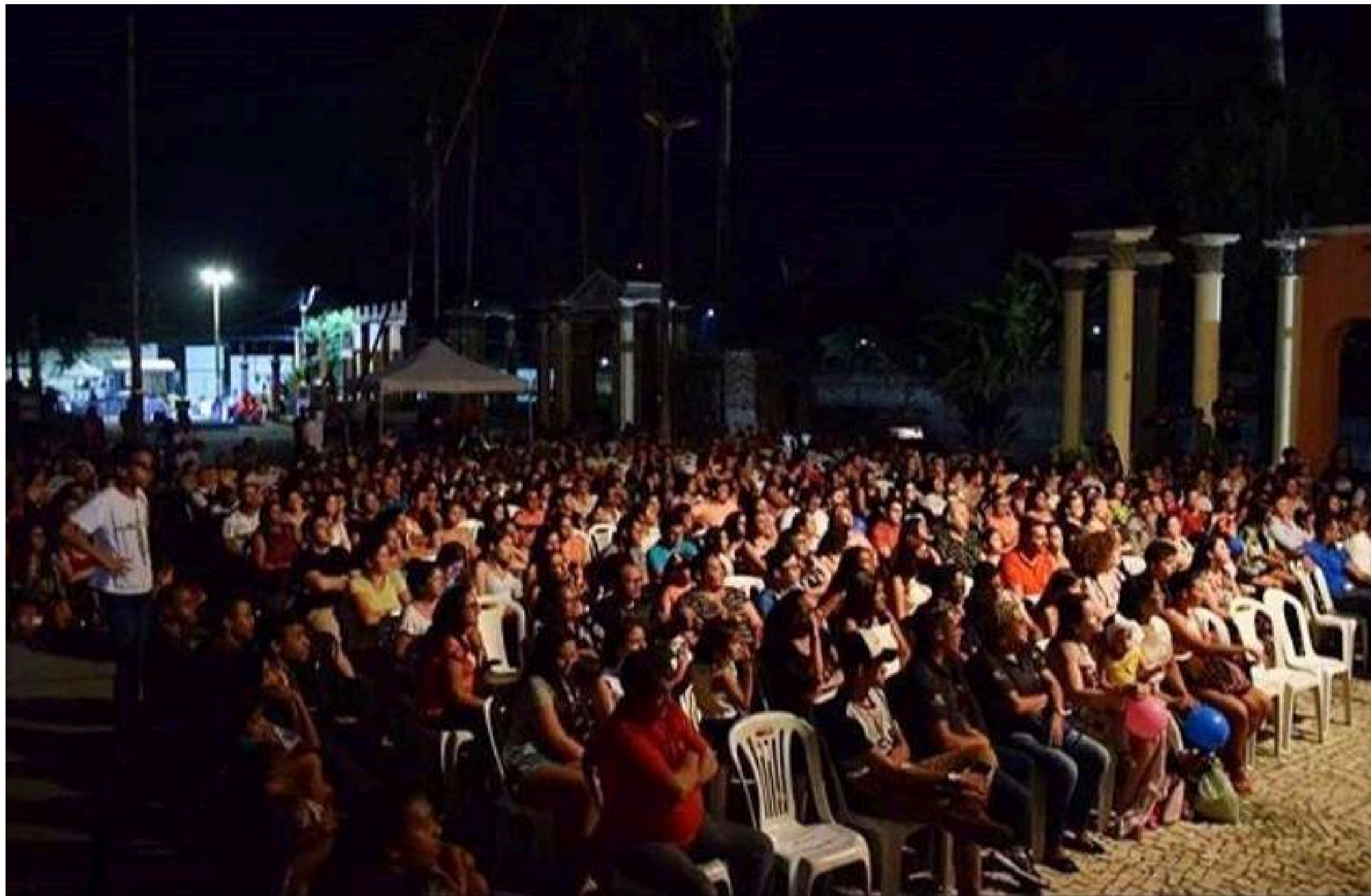
Bienal Intenacional de Dança -2018 Praça da Paixão - Centro - Pacatuba