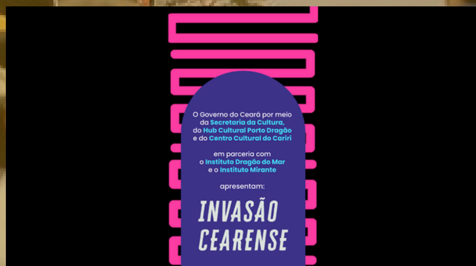
Invasão Cearense - SIM SP Instituto Dragão do Mar