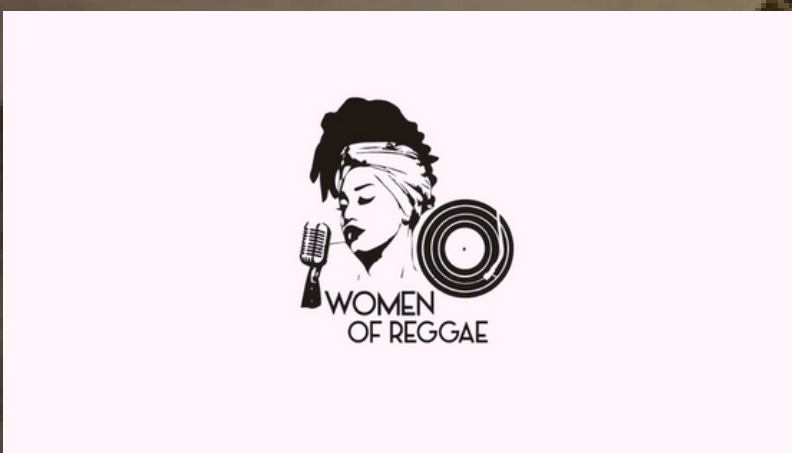
Women of Reggae (CE)