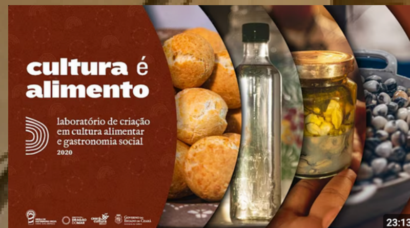
Laboratório de Criação em Cultura Alimentar e Gastronomia Social