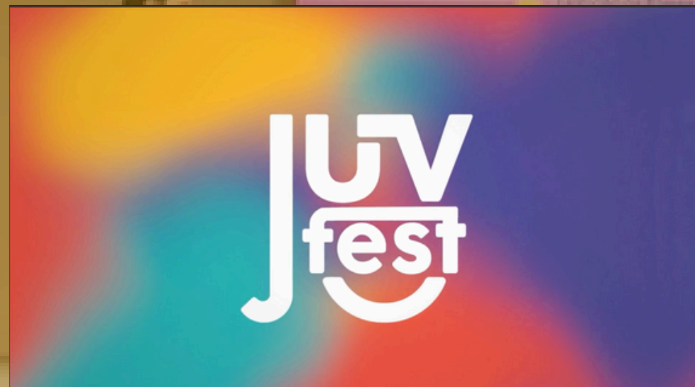
Juvfest - Secretaria da Juventude de Fortaleza