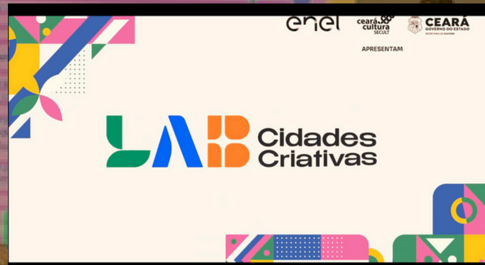
Lab Cidades Criativas e Cine+ Quitanda Soluções Criativas