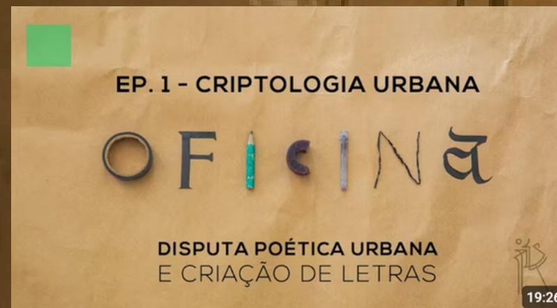
Disputa Poética Urbana e Criação de Letras Finaciado pela Lei Aldir Blanc