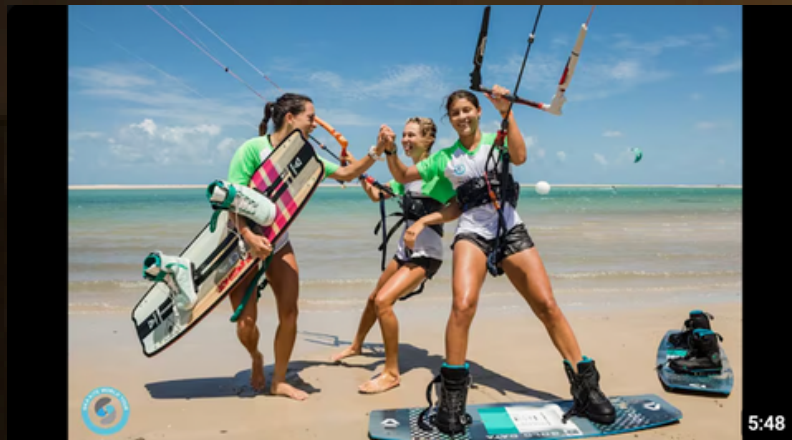
GKA SuperKite Brazil 2020