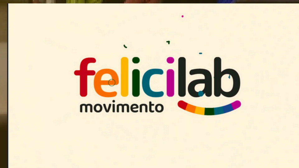
Cobertura Audiovisual FeliciLab Finaciado pelo Ministério da Saúde