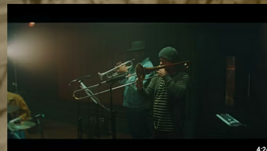
Que Delícia é Viver - Animal Invisível