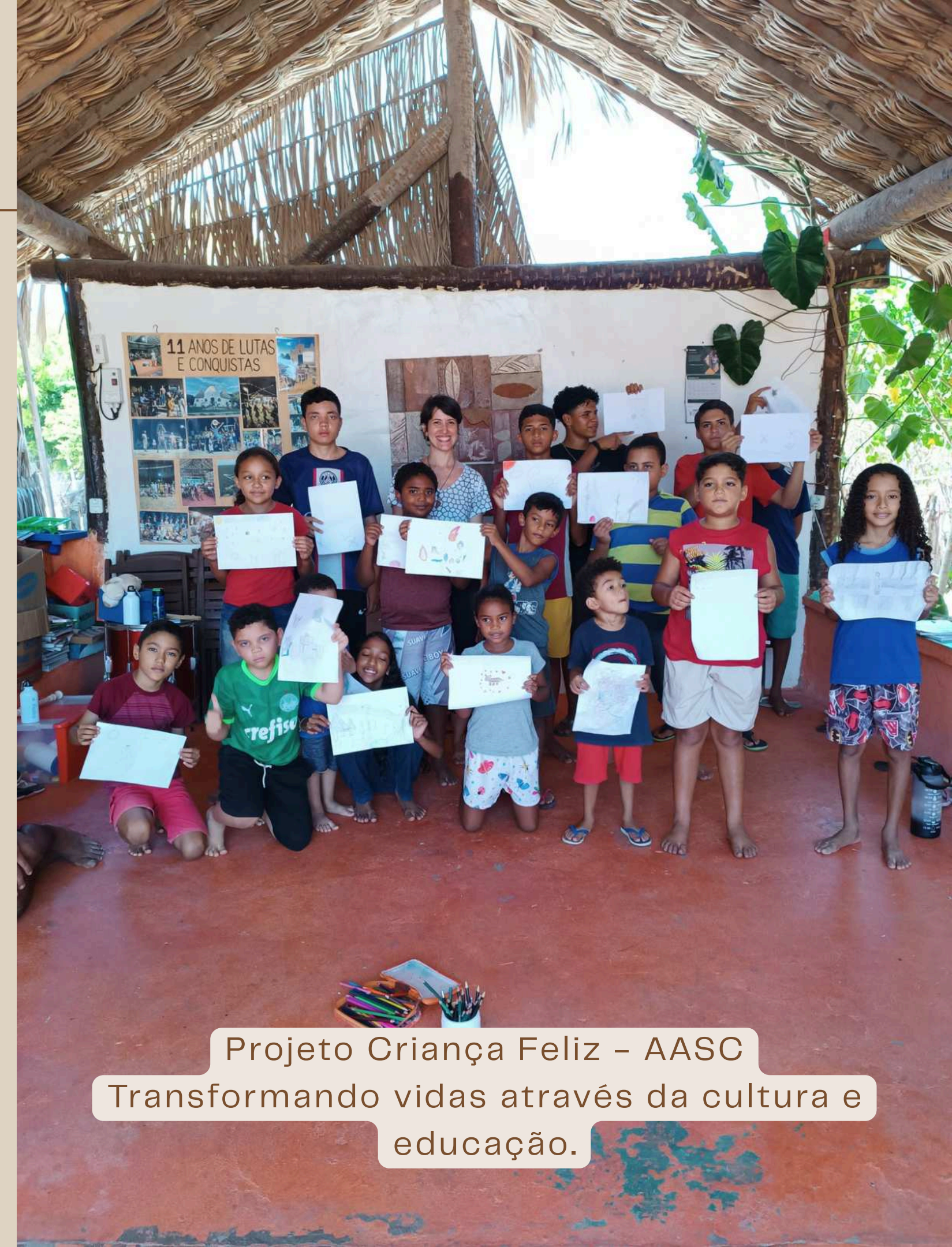
Projeto Criança Feliz – AASC Transformando vidas através da cultura e educação.

A diversidade de oficinas e a dedicação dos voluntários contribuem para o desenvolvimento social e artístico das crianças e adolescentes atendidos.