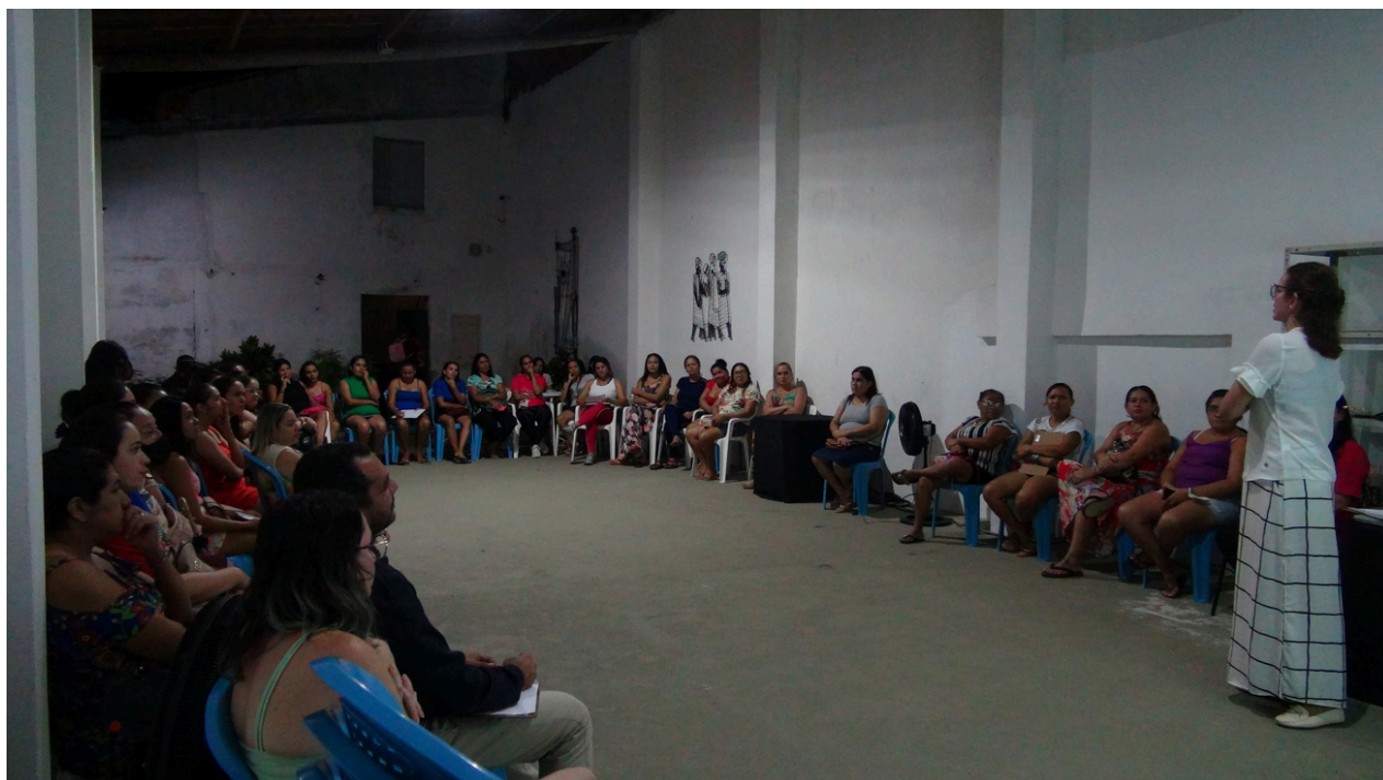
Coordenação - Reunião de Responsáveis Turma de Dança - 2023 Programa de Formação Básica de Dança