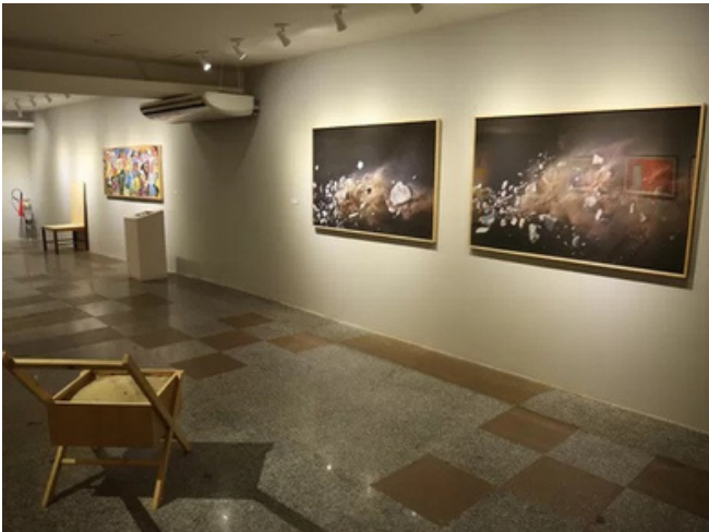
Criação - Ação educativa XVIII Unifor Plásticas- Respire antes de ver - 2015