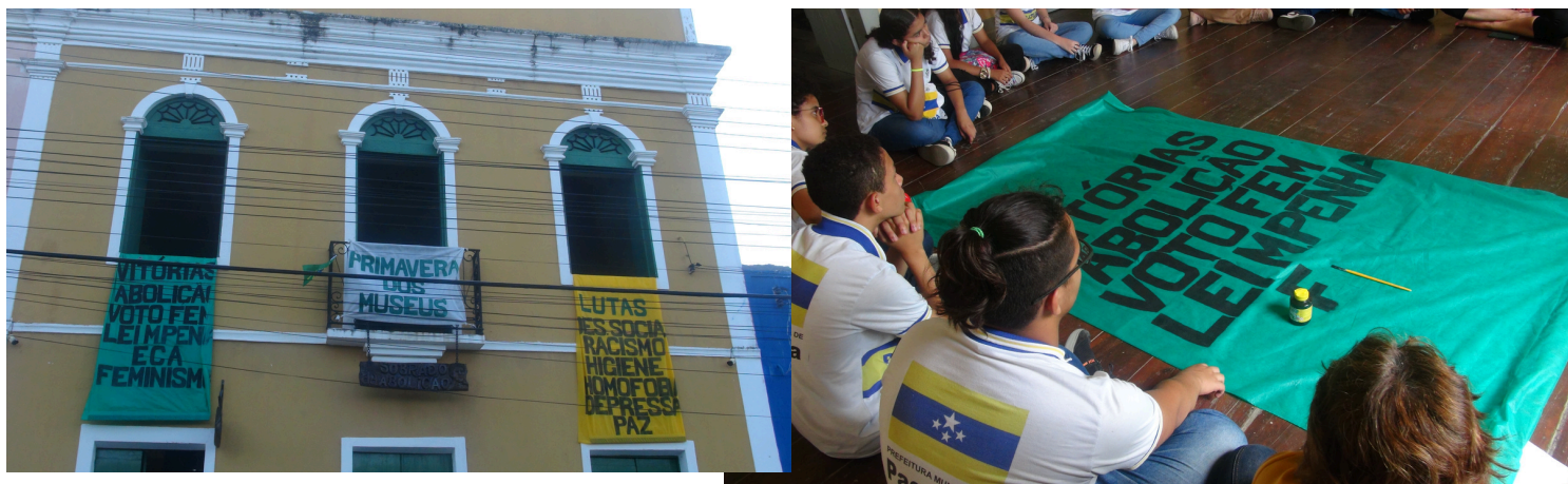
Ação Educativa - Primavera dos Museus - 2022