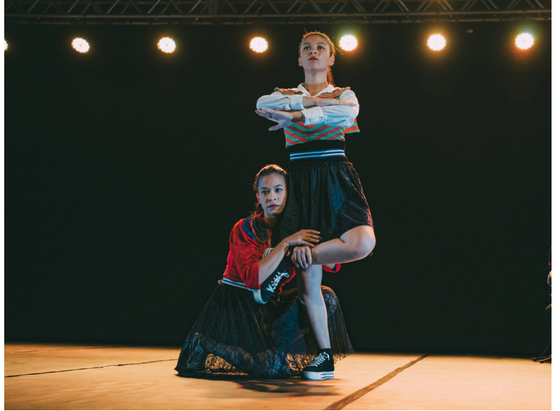
Dramatugista Espetáculo "Grandeza com Choros e Sambas" - 2023