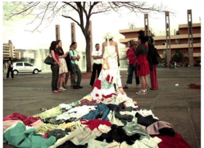
Criação - Performance - Instalação - O Vestido Assemblage: criação de uma vestimenta que costura em diferentes texturas de tecido, lembranças significativas 2009 a 2014 - MG e CE