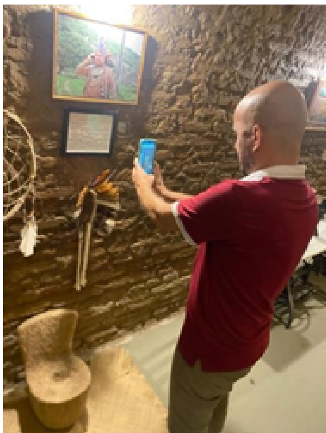
Mediação - Acessibilidade Digital e em LIBRAS - 2025 História e Memória através do legado Ancestral de povos originários e afrodiaspórico