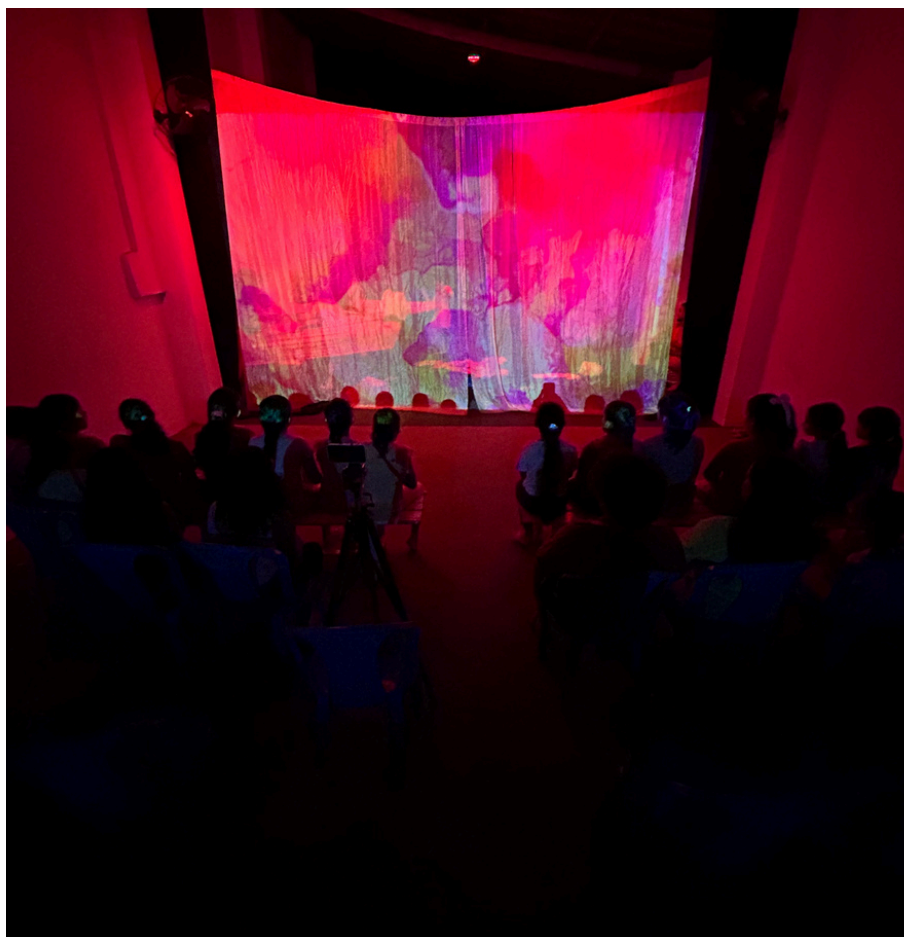
Produção - Espetáculo Bzz... Jônatas Joca e Grupo DIA -2025 Realizado com crianças autistas