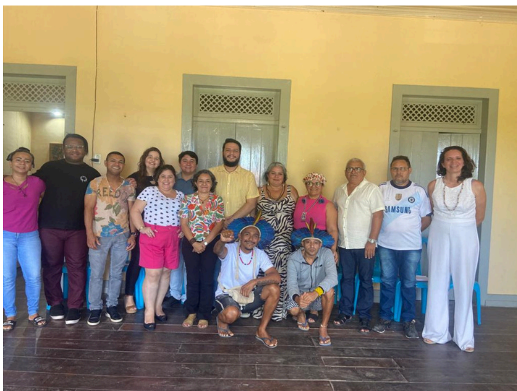
Articulação Intersetorial - Primavera dos Museus - 2023