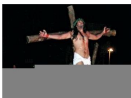
O espetáculo da Paixão de Cristo conta com a participação de cerca de 1.500 pessoas na produção, contando com o apoio da Paróquia local ( )

O espetáculo da encenação da morte e Ressurreição de Jesus Cristo se estende até o dia de hoje