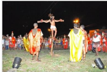
Foto da encenação de atos anteriores da Paixão de Cristo em Senador Pompeu, Fundação Santa Terezinha.

A Semana Santa, ocasião em que é celebrada a Paixão de Cristo, que os cristãos passam por momentos de entrega, sacrifícios e de transformações em sua fé. A Paixão de Cristo, uma história em que o povo consegue narrar com intensidade e verdade no olhar. Trata-se da encenação dos últimos momentos antes da crucificação e os primeiros após a ressurreição.